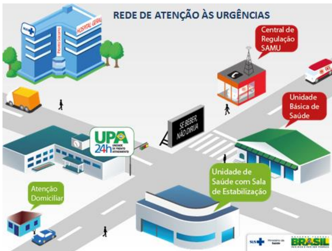
Figura 01 – Desenho da Rede de Urgência e Emergência

A organização do Plano da rede de Urgência e Emergência tem a finalidade de articular e integrar todos os equipamentos de saúde objetivando ampliar e qualificar o acesso humanizado e integral aos usuários em situação de urgência nos serviços de saúde de forma ágil e oportuna.