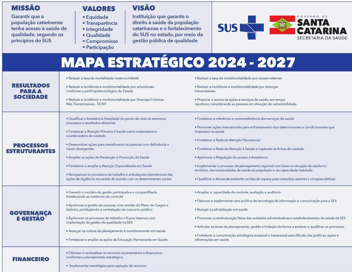
Figura 1 - Mapa Estratégico da Secretaria Estadual de Saúde. Santa Catarina, 2024.