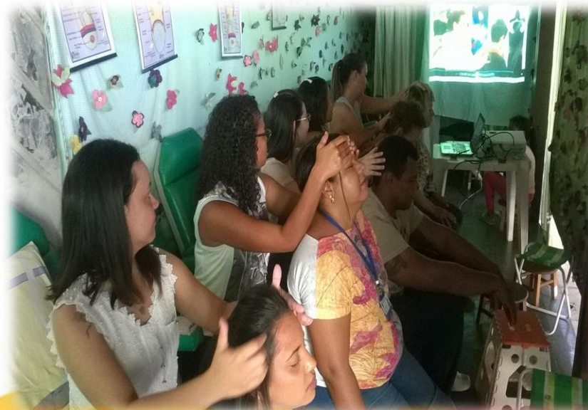
Práticas Integrativas - Oficina “Cuidando de quem cuida”