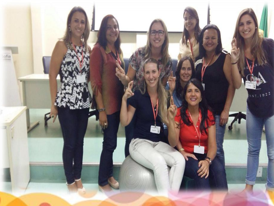
Recepção e apresentação da turma 7