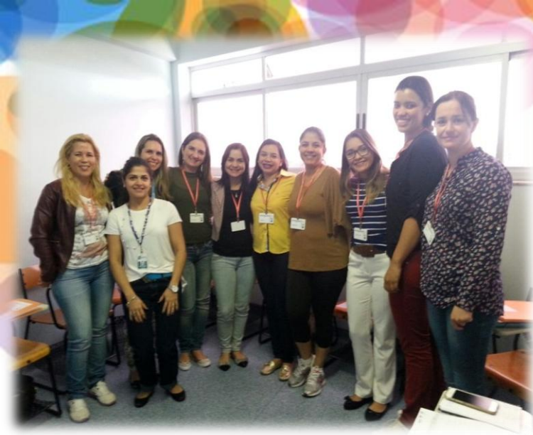
Recepção e apresentação da turma 2