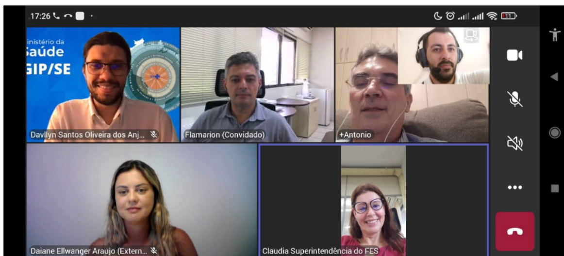
Figura 06-plenária Geral de Discussão (Parte 01)

Abaixo seguem imagens que evidenciam a realização do evento.